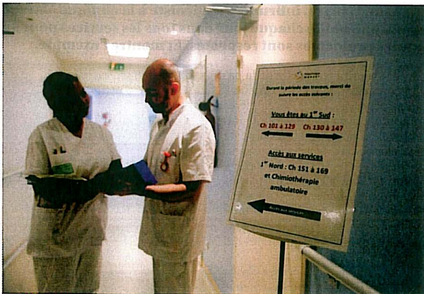
PRÉCAUTIONS La signalétique mise en place dans l'établissement pendant la durée des travaux fait partie intégrante de sa politique d'hygiène.